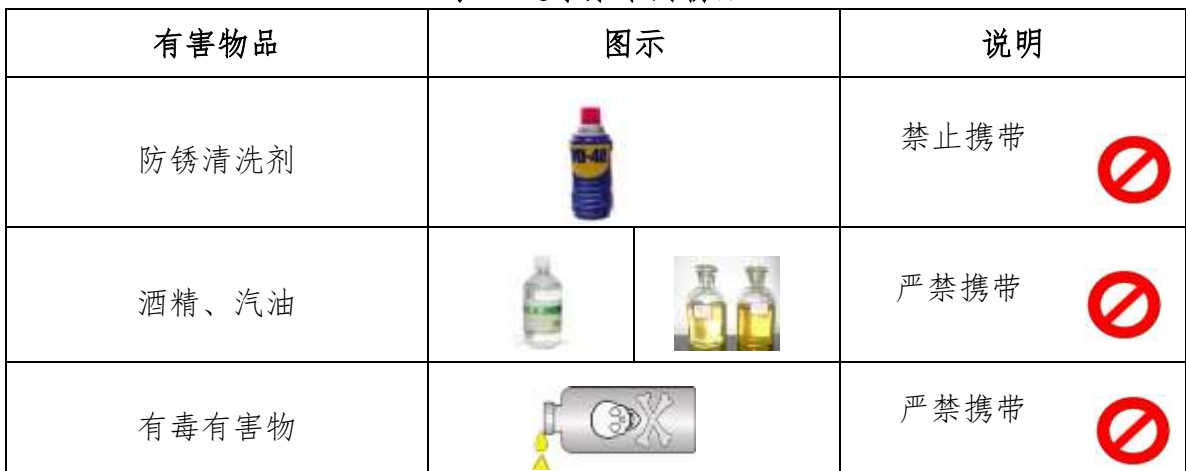
表 6 选手禁带的物品