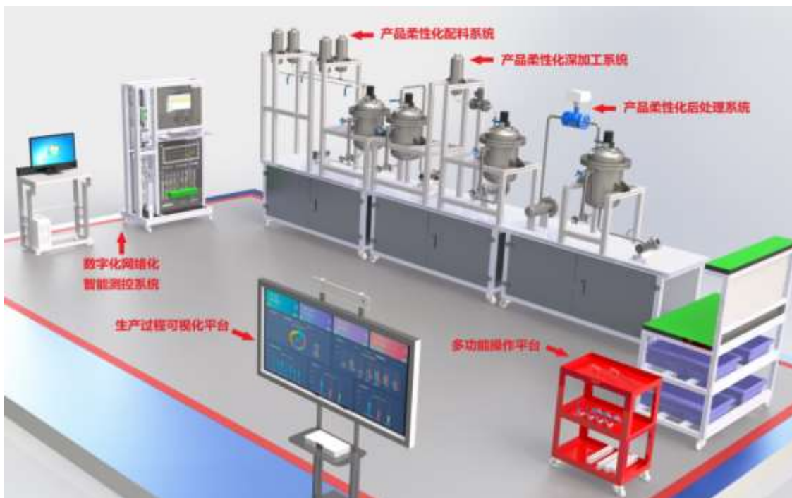
图 1 仪器仪表制造工竞赛平台总布局简图

仪器仪表制造工竞赛平台总布局简图如图 1 所示。包含产品柔性化配料系统、产品柔性化深加工系统、产品柔性化后处理系统、数字化网络化智能测控系统、生产过程可视化平台、多功能操作实训台和辅助监考系统。