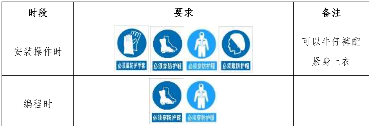
表 5 选手防护装备佩带要求

大赛时，裁判员对违反安全与健康条例、违反操作规程的选手和现象将提出警告并进行纠正。不听警告，不进行纠正的参赛选手会受到不允许进入竞赛现场、罚去安全分、停止竞赛、取消竞赛资格等不同程度的惩罚。选手防护装备佩带要求见表 5。