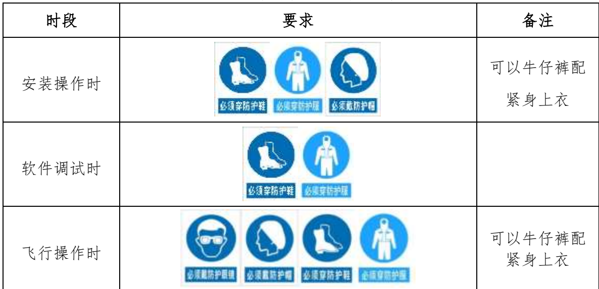
表 5 选手防护装备佩带要求

大赛时，裁判员对违反安全与健康条例、违反操作规程的选手和现象将提出警告并进行纠正。不听警告，不进行纠正的参赛选手会受到不允许进入竞赛现场、罚去安全分、停止竞赛、取消竞赛资格等不同程度的惩罚。选手防护装备佩带要求见表 5。