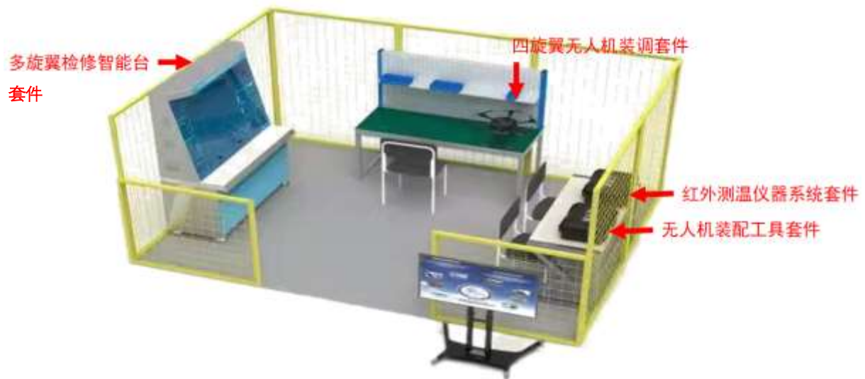
图 1 无人机装调检修竞赛平台布局图(仅供参考)

巡检模拟管道采用 PVC 材质（直径约 40cm），其架设采用多层结构模拟复杂环境；检测点采用 USB 发热片，充电宝供电。检测作业场地布局如图 2 所示，尺寸约为长 6m×宽 5m×高 5m，架设五面安全防护网绳，主要用于完成无人机飞行操控、无人机检测应用等比赛任务。