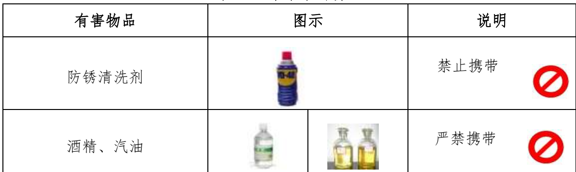
表 6 选手禁带的物品