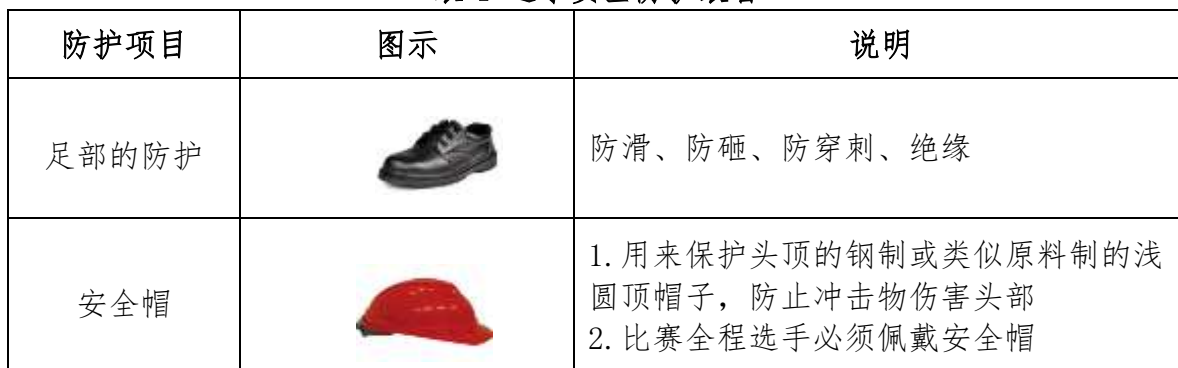
表 4 选手安全防护装备