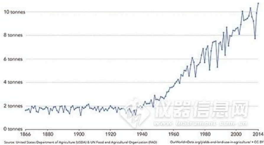
图 1: 1866-2014 年, 美国每公顷玉米平均产量, 来自数据世界, 未经修改。

自然土壤分析自 1960 年以来发展至今, 以经历数个阶段, 过去十年来常见方法是收集一个田地不同地点的样本, 在不到 20 英亩的田地中, 随机地点采集了 15 到 20 个单独的样本。将采集的土壤混合, 测试土壤中的 pH 水平、植物可用的 N、P、K、Mg、Ca 等物质的浓度。在某些情况下, 还需要检测土壤中的有机质的百分比和微量金属, 土壤检测实验室会采用多种方法检测, 从滴定测量方法到 ICP-MS。